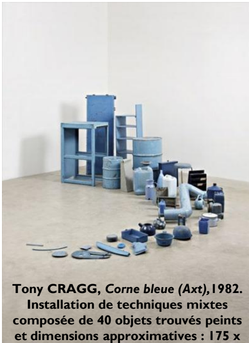
Tony CRAGG, Corne bleue (Axt) , 1982. Installation de techniques mixtes composée de 40 objets trouvés peints et dimensions approximatives : 175 x 360 x 470 cm.