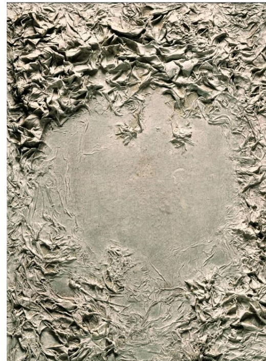
Robert MALAVAL, Petit aliment blanc , 1961, 35x26cm. technique mixte.

Etape 8 : Poursuivez votre réalisation et dans votre cahier ou sur une feuille, décrivez l'évolution de votre travail : ce qui a changé et ce que vous ressentez.