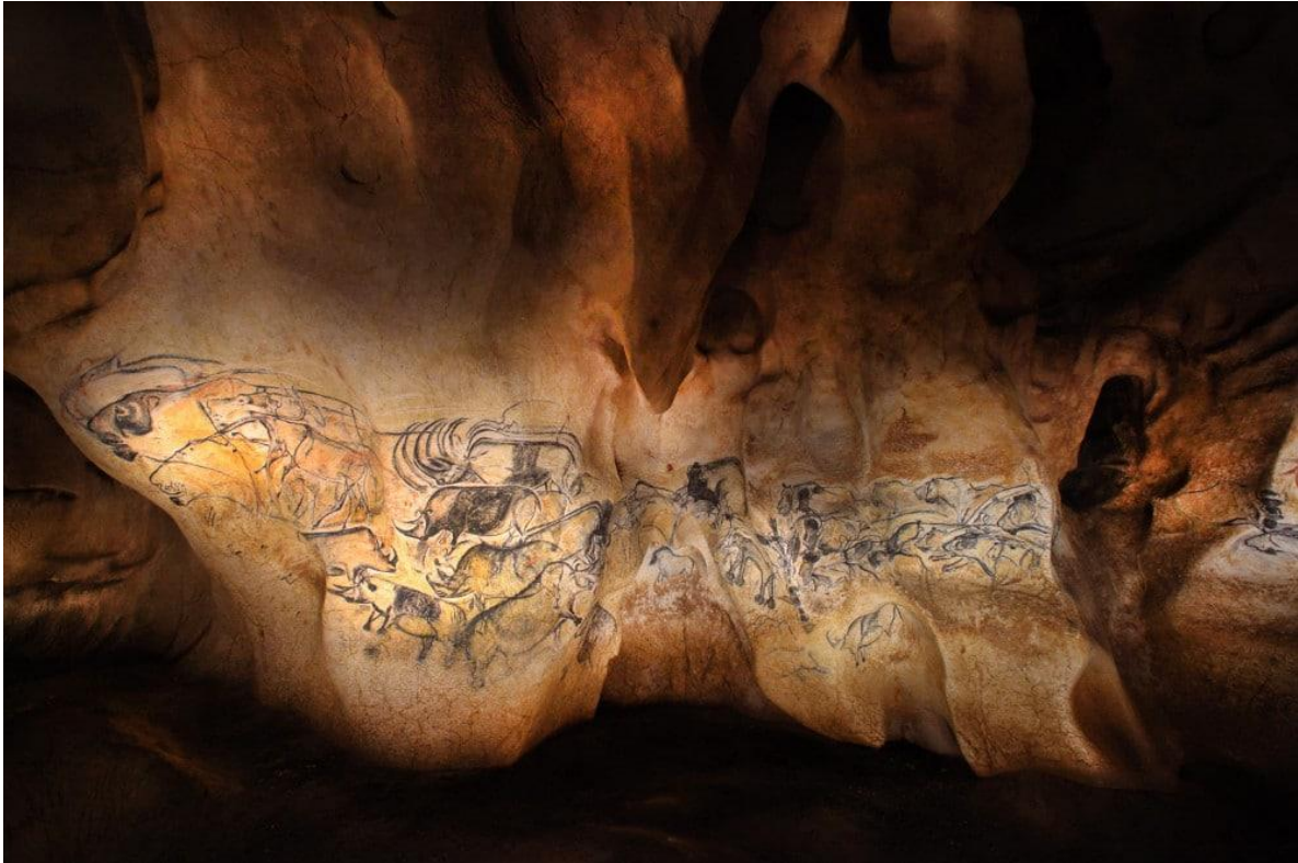
Credit image : Panneau des lions / Grotte Chauvet / Arnaud Frich / Centre National de Préhistoire / Ministère de la Culture et de la Communication

Après avoir bien observé le document suivant, tu réponds aux trois questions en suivant bien les consignes.