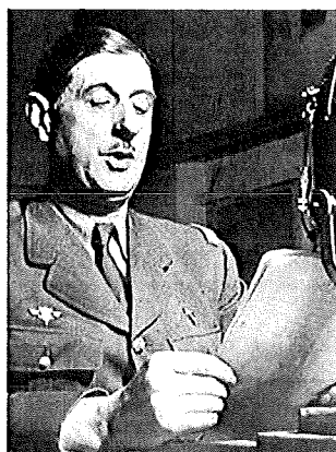
18 juin 1940 :